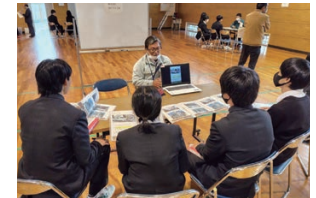
昨年のガイダンス