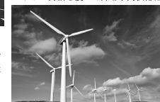
炭素繊維を使った風力発電用の羽根